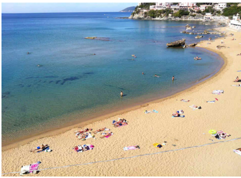
Baia del Quercetano