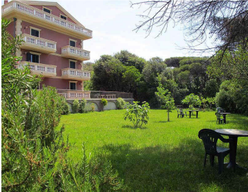
Residenza "Villa Casa Marina"