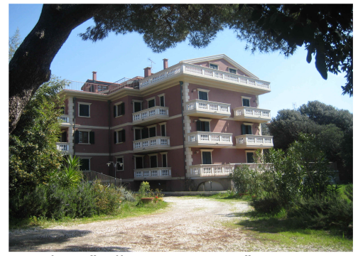
Residenz "Villa Casa Marina"