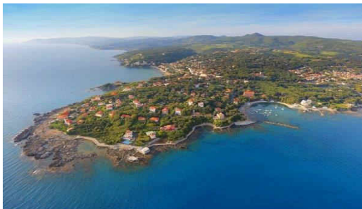
Panorama von Castiglioncello