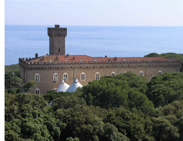
Castello Pasquini (Sitz der Schule)